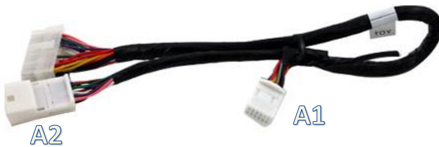
6+6 pins aansluiting

Sluit stekker A1 aan op het corresponderende contact van de Toyota-radio. Druk de stekker zover aan dat deze niet meer verder kan. Koppel een eventuele stekker op dezelfde positie los (navigatie) en sluit deze over op stekker A2.